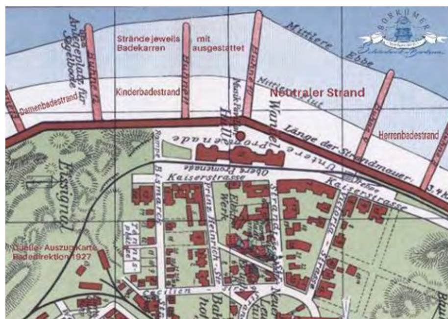
Nützlich Auszug Karte Badedirektion 1927

Jeder Badegast der länger als drei Tage sich auf der Insel aufhielt; von dem wurde pro Person 1 Mark